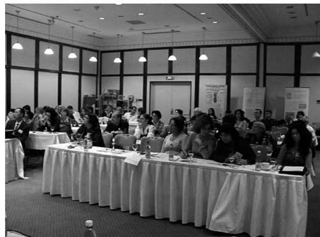
Figure 2. La nombreuse assistance.

d'un point de vue traditionnel (acupuncture, massage, phytothérapie, qigong , diététique que d'un point de vue scientifique (recherche, evidence based medicine médecine factuelle- essais contrôlés randomisés). La tradition et la modernité combinées harmonieusement ont apporté pendant ces deux jours une atmosphère générale équilibrée, tonique, riche en informations suscitant un réel intérêt pour tout acupuncteur avide de formation. L'un des objectifs du congrès était de rassembler les acupuncteurs roumains et de leur offrir par cet événement international un nouveau souffle et une ouverture vers la qualité des manifestations scientifiques (Figure 2). La nombreuse participation a montré que les organisateurs ne s'étaient pas trompés et que la réussite était au rendez-vous. Ainsi, ce fut une grande surprise pour tous de découvrir l'importante participation des étudiants en 4 ème et 5 ème années de la Faculté de médecine Carol Davila de Bucarest.