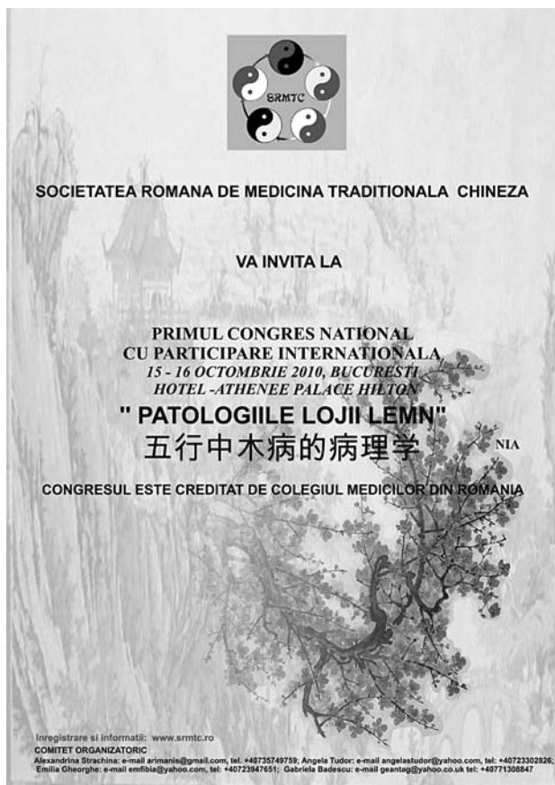
Figure 1. L'affiche du congrès du SRMTC.

Les 15 et 16 octobre 2010, l'hôtel Hilton à Bucarest a hébergé le premier Congrès National d'acupuncture, avec une participation internationale, organisé par une des plus jeunes sociétés de médecine chinoise d'Europe (Figure 1), puisque née en 2009, la Société Roumaine de Médecine Traditionnelle Chinoise (SRMTC).