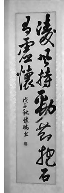
Figure 7. La calligraphie du Professeur Zhao Lixin.

Pour finir et rester dans la tradition, la jeune Société roumaine a apprécié le conseil de Laozi magistralement présenté par la calligraphie du Professeur Zhao Lixin (Figure 7) : « la force du Vent teste la puissance de l'herbe. Seule l'herbe la plus résistante peut se tenir debout face aux Vents puissants. 风持劲草. Ayez l'Esprit ouvert comme une vallée : humilité et grande ouverture 抱石若虚怀 ».